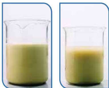
VONDOCEB 80 WP (80 - 85%)