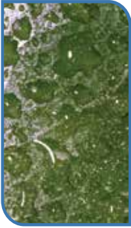
VONDOCEB 80 WP